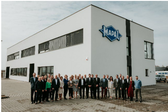
Bild 1: Das neue Bürogebäude von MAPAL am Standort Komornki/Polen. Zur Eröffnung kamen zahlreiche Gäste.